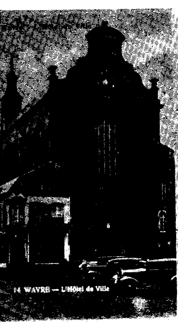
14 WAVRE — L'Hôtel de Ville