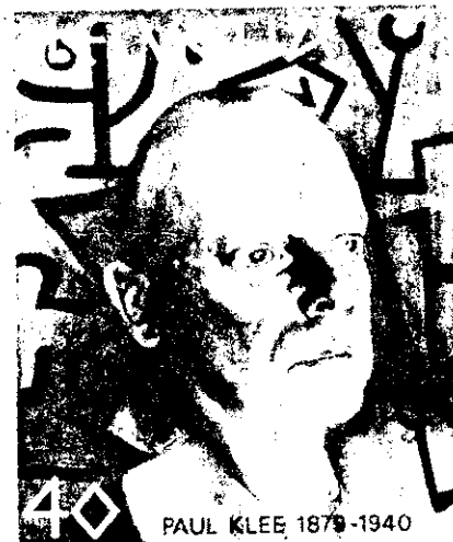
PAUL KLEE 1879-1940

est né le 18 décembre 1879 à Münchenbuchsee, près de Berne. Il fait ses écoles dans la ville fédérale où ses parents s'installent peu après sa naissance. Une fois en possession de son certificat de maturité, il n'a pas encore 20 ans, il commence des études de peinture à Munich; il se rend ensuite en Italie, puis rentre en Suisse. De retour à Munich en 1906, il épouse une pianiste. Ses contacts notamment avec Kandinsky, sa participation à une exposition des artistes du Blaue Reiter et la peinture contemporaine française marquent profondément sa personnalité et son style. La couleur lui est révélée lors d'un voyage en Tunisie. En 1920, il est nommé professeur au Bauhaus à Weimar, qui est transféré par la suite à Dessau. Des expositions en Europe et outre-mer consacrent sa réputation d'artiste d'expression moderne. En 1933, deux ans après sa nomination comme professeur à l'académie de Düsseldorf, il quitte l'Allemagne et retourne à Berne où il subit