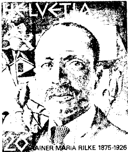
RAINIER MARIA RILKE 1875-1926

Fils d'une famille autrichienne de fonctionnaires, est né à Prague le 4 décembre 1875. Destiné au métier des armes, il fréquente les écoles militaires de St Pölten, où il quitte en 1892 en raison de sa très grande sensibilité. Il prépare alors ses examens de maturité en suivant des cours privés, puis étudie les beaux-arts et la littérature à Prague. Vivant ensuite de sa plume, il séjourne à Munich et à Paris où ses stages sont fréquemment interrompus par des voyages en Italie, en Russie et dans le Grand Nord, mais aussi en Espagne, en Afrique du Nord et en Egypte. A la fin de la première guerre mondiale, après avoir erré pendant de nombreuses années à travers le monde, Rilke se fixe en Suisse où il trouve enfin au château de Muzot, près de Sierre, le repos qui lui est nécessaire pour achever son abondante oeuvre poétique et lyrique, émaillée de poèmes d'une