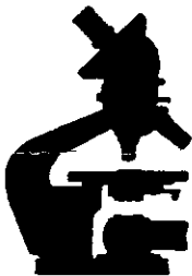
Un matériel très performant réservé aux seuls experts.

Le matériel technique est constitué par un ensemble d'instruments qui facilitent l'examen. Les loupes de l'expert doivent répondre à des besoins précis, il est nécessaire de disposer de plusieurs grossissements, les combinaisons optiques ne doivent déformer ni les surfaces ni les couleurs. Les microscopes seront employés pour l'étude des détails. Combinés avec l'utilisation d'éclairages mobiles, ils permettent de scruter la surface, de vérifier l'homogénéité d'un papier ou la granulation d'une encre.