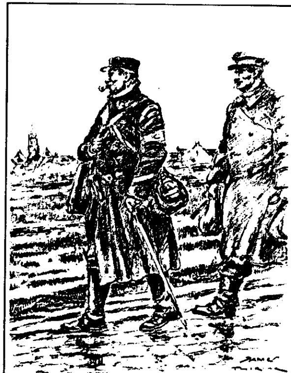
MUSEE DES POSTES ET TELECOMMUNICATIONS Le facteur aux armées (1916) d'après un dessin de James Thiriar

Le projet a été conçu par la "Bundespost" allemande, en étroite collaboration avec les PTT belges et les postes autrichiennes. Les cavaliers appartiennent aux trois pays concernés.