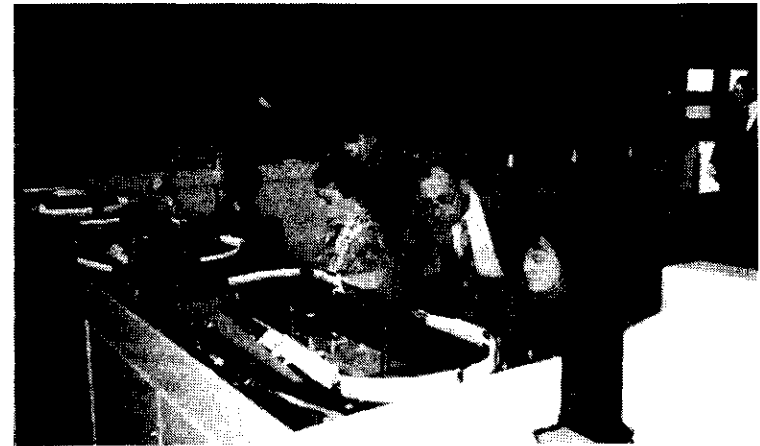
Ensemble de trois pupitres et de 15 canaux. A noter que l'opératrice sur le pupitre n° 1 est une élève du BPP de Wavre 1, en cours de formation.

Le convoyeur principal se prolonge jusqu'au dernier casier de sortie et véhicule tous les envois quittant les pupitres qui rencontrent les 24 aiguillages commandés par l'ordinateur. En fonction de la position ouverte ou fermée, l'envoi rempli l'entasseur ou le suivant.