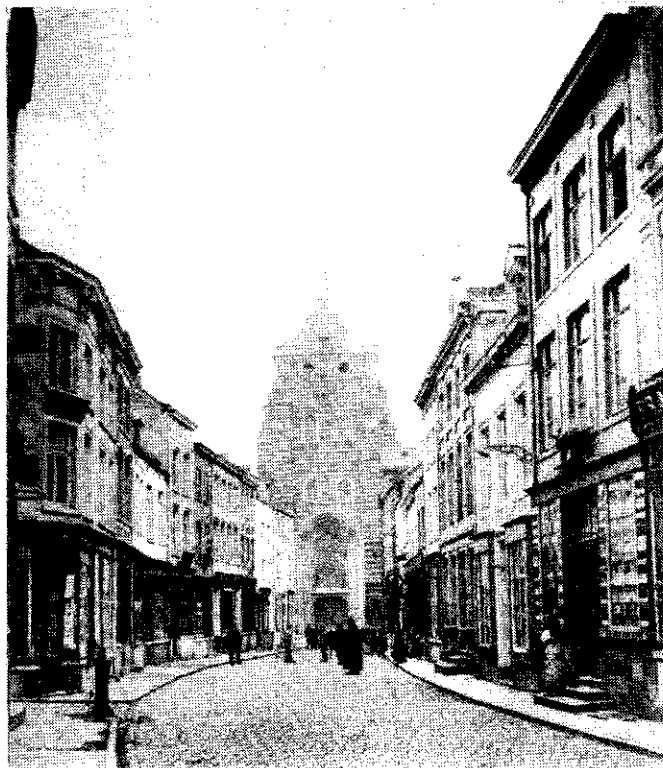
Wavre. La Rue du Commerce.