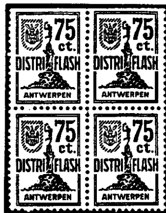
Bloc de 4

Chaque "facteur" distribuera 2.000 imprimés par jour. Il faudra 2.000 "facteurs".