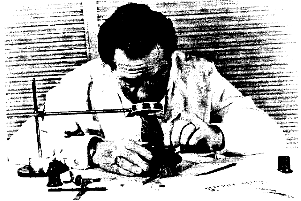
Le graveur à l'ouvrage avec ses outils spéciaux.

Le graveur doit pouvoir interpréter le projet de timbre-poste qui lui est confié, reproduire l'expression convenable et le caractère de chaque détail. Il devra utiliser ses burins de telle manière que le sujet du timbre soit reproduit le plus fidèlement