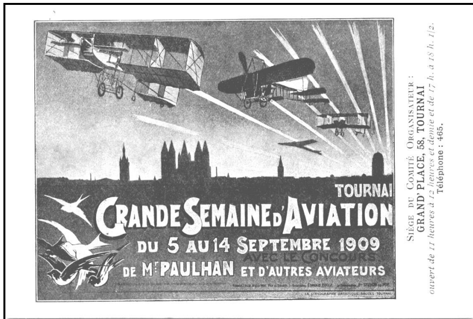
Figure 1 : Carte Postale reproduisant l'affiche officielle annonçant la Grande Semaine d'Aviation de TOURNAI, du 5 au 14 septembre 1909..

Le dimanche 25 Juillet 1909, soit quelques semaines avant la Semaine d'Aviation de TOURNAI, BLERIOT venait de traverser les 43 km de la MANCHE en 37 minutes, exploit qui eut un retentissement mondial, tout comme la "Grande Semaine de Champagne" à REIMS, qui eut lieu du 22 au 29 Août 1909, soit une semaine avant le meeting de TOURNAI.